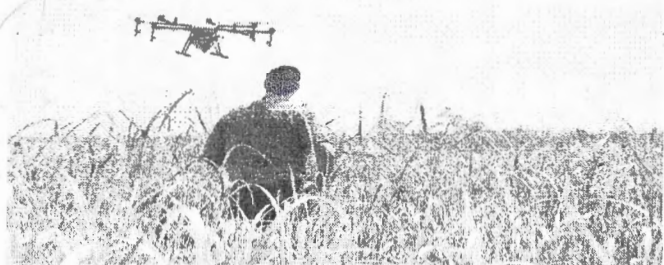
5G nacional seguirá os preços internacionais até que a massificação do serviço derrube o preço dos chips e dos aparelhos.